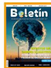
83. Efectos del Cambio Climático: Acciones para enfrentarlos y Políticas actuales en México (Parte II) Marzo-Abril 2024