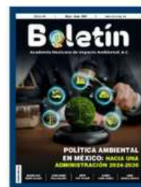
84. Política Ambiental en México: Hacia una Administración 2024-2030 Mayo-Junio 2024