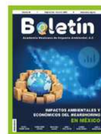
86. Impactos ambientales y económicos del Nearshoring en México Septiembre-Octubre 2024