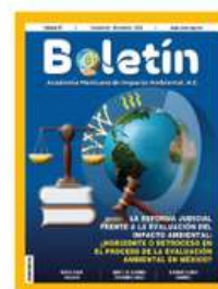
87. La Reforma judicial frente a la Evaluación del Impacto Ambiental (horizonte o retroceso en el proceso de EIA en México?) Noviembre-Diciembre 2024