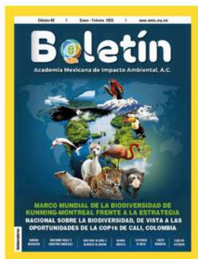
Marco mundial de la biodiversidad de Kunming-Montreal frente a la estrategia nacional sobre biodiversidad, de vista a las oportunidades de la COP16 de Cali, Colombia